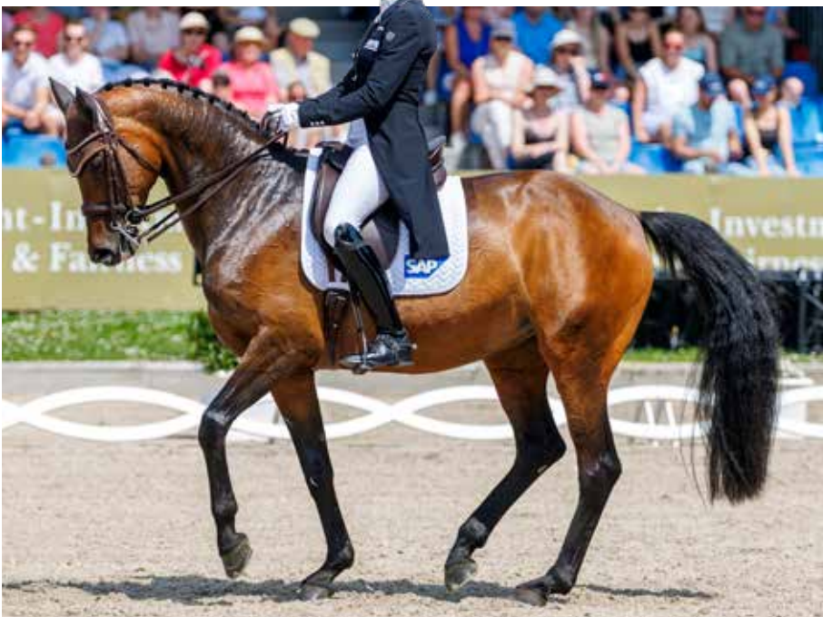
Wie gut war der Ritt? Der Grand Prix Special im Rahmen der Deutschen Meisterschaften lässt sich auch vom Experten kommentiert verfolgen.