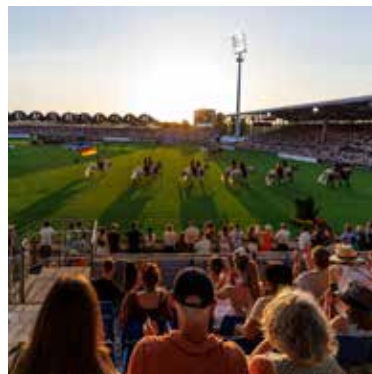
Die Aachener Soers ist 2026 die Bühne für die FEI Weltmeisterschaften.

PM ab 889 Euro, Nicht-PM ab 989 Euro, EZ-Zuschlag ab 275 Euro