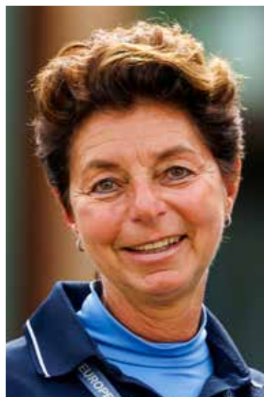
Monica Theodorescu ist bereits seit 2012 Bundestrainerin der deutschen Dressurreiterei – als erste Frau in diesem Amt.

Monica Theodorescu: Ich wünsche mir, dass wir Sport zeigen, hinter dem wir alle stehen können. Natürlich wollen wir erfolgreich sein – das gehört dazu. Aber genauso wichtig ist für mich, dass wir harmonische Bilder zeigen und eine positive Atmosphäre schaffen. Wenn uns das gelingt, wird Aachen nicht nur sportlich erfolgreich, sondern auch ein starkes Signal für