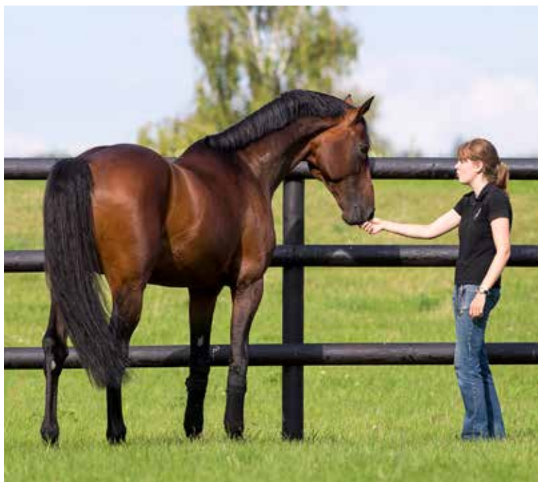
Wer sein Pferd gut kennt und ihm aufmerksam begegnet, wird Abweichungen im Verhalten besser wahrnehmen und einschätzen können.