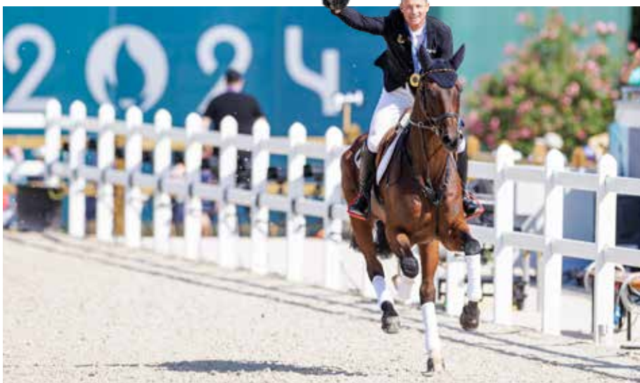
Michael Jung und Chipmunk FRH, Olympiasieger 2024 – Road2LA ergänzt die bestehende Förderung und will helfen, künftige Erfolge im deutschen Vielseitigkeitsreiten zu sichern.