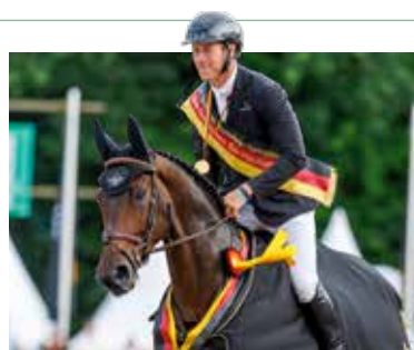
Ob im Springen, der Dressur, der Vielseitigkeit oder bei den Reitpferden und -ponys – die Schärpe des Bundeschampions ist heiß begehrt.

PM 329 Euro, Nicht-PM 389 Euro, EZ-Zuschlag 80 Euro