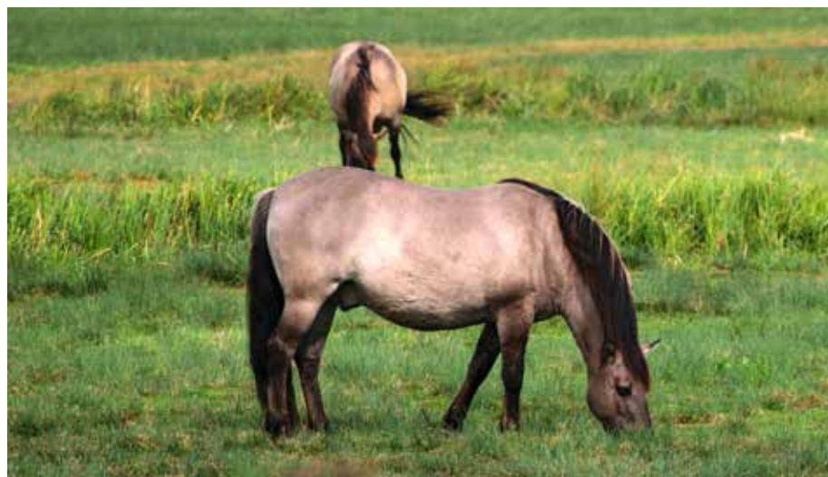
Koniks werden gerne zur Landschaftspflege eingesetzt, so auch in der Oranienbaumer Heide, wo man sie bei einer geführten Radtour erleben kann.

PM 15 Euro, Nicht-PM 25 Euro (im Seminarpreis sind die Verpflegung – ein kleines Catering mit Bratwurst/Buletten vom Heckrind – sowie Ge-