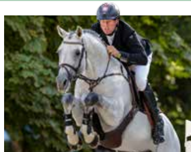
Auf der Hengststation Sosath in Lemwerder stehen viele hochklassige Hengste, darunter Casino Berlin OLD.

PM 599 Euro, Nicht-PM 699 Euro, EZ-Zuschlag 79 Euro