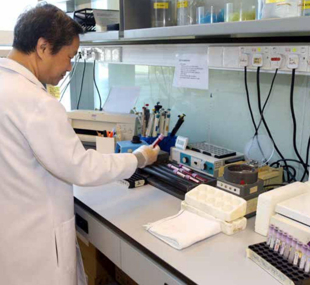
Im Labor kann das Blut auf unterschiedliche Parameter hin untersucht werden – welche es sein sollen, entscheidet der Tierarzt im Einzelfall.

ein Prozent im Blut zirkuliert. Der Calciumspiegel im Blut wird – insbesondere durch Parathormon, Calcitonin und Vitamin D – streng reguliert. Selbst bei einer vorüberge-