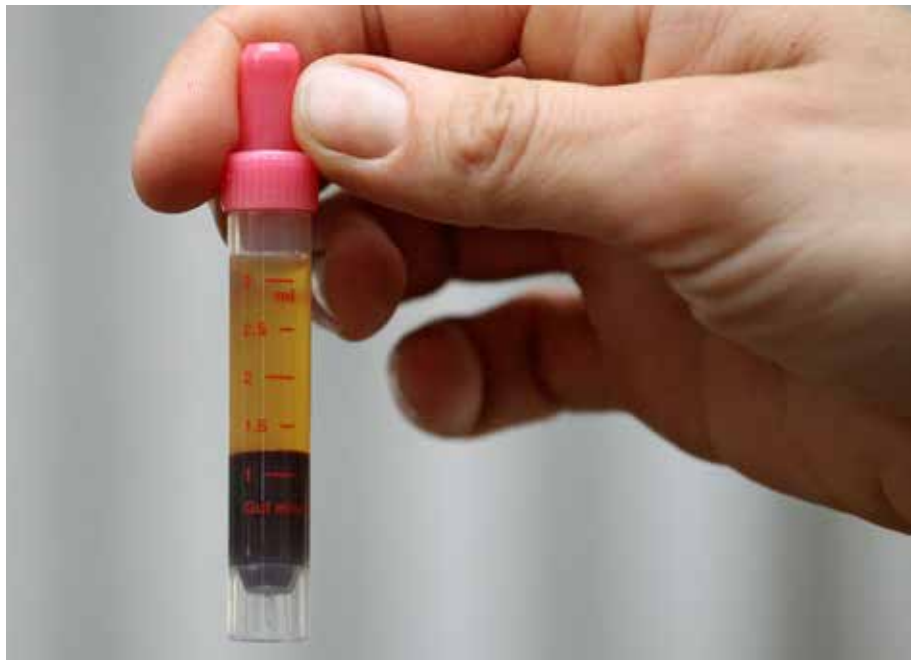
Gut zu erkennen: Blut und davon abgesetzt das Blutplasma, der flüssige, zellfreie Anteil des Bluts, der vor allem aus Wasser, Proteinen, Nährstoffen und Hormonen besteht.

hend unzureichenden Aufnahme kann der Organismus auf seine Speicher zurückgreifen und den Blutwert stabil halten. Umgekehrt kann ein erniedrigter Gesamtcalciumwert durch Faktoren wie einen niedrigen Albuminspiegel entstehen, ohne dass die biologisch aktive, ionisierte Calciumfraktion tatsächlich vermindert ist.