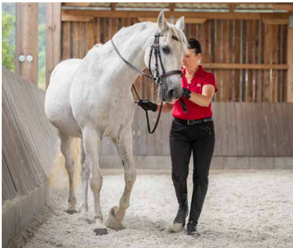
Ein Online-Seminar führt ein in die Arbeit mit Pferden an der Hand.