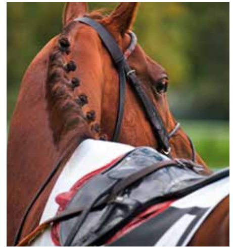
Eintauchen in die Welt der Vollblüter und die Leidenschaft für sie, bei einer Besichtigung von Schlossgut Itlingen.

PM-Exkursion Leidenschaft für Vollblüter – Blick hinter die Kulissen auf dem Schlossgut Itlingen mit Philipp Graf Stauffenberg Sonntag, 19. Juli Schlossgut Itlingen in Ascheberg-Herbern Beginn 12 Uhr PM 20 Euro, Nicht-PM 32 Euro Info/Anmeldung: siehe Seite 43