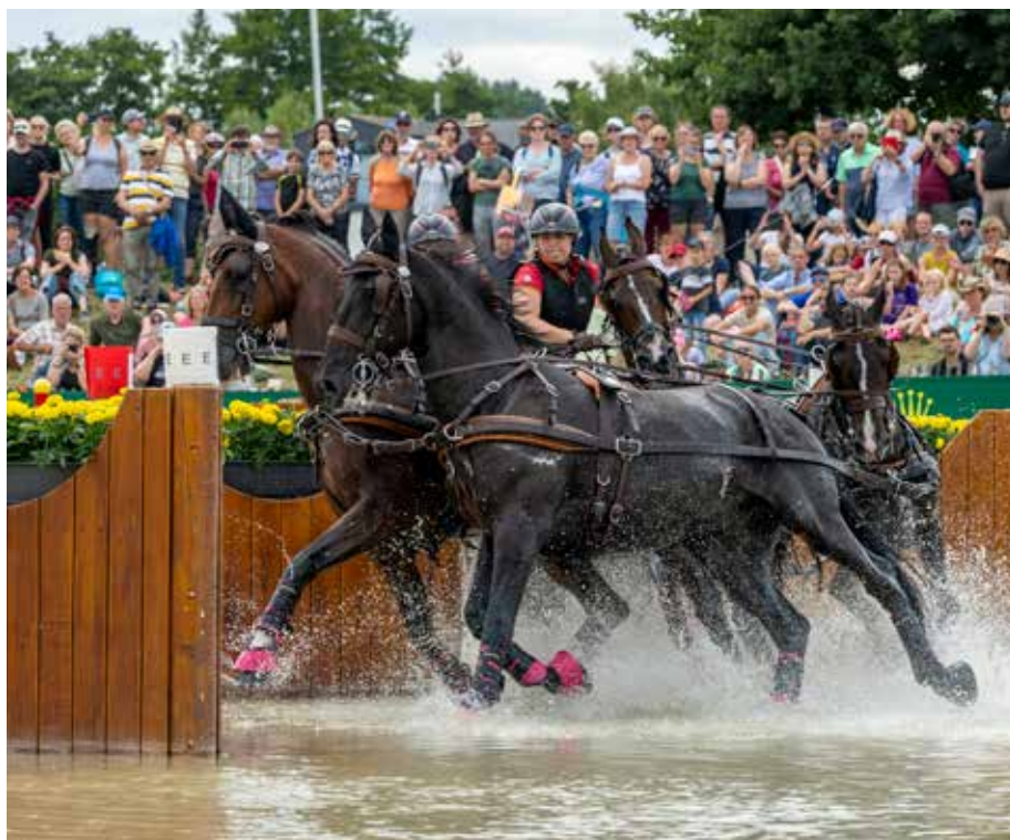
Bei der WM in Aachen die Geländestrecke der Vierspanner vom Fachexperten eingeordnet besichtigen – möglich bei einem Seminar von Pferdesport Deutschland.