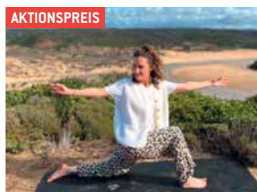
Portugal lockt mit toller Natur zu einer erholsamen Auszeit mit Yoga und Reiten.

PM 2.159 Euro, Nicht-PM 2.259 Euro, EZ-Zuschlag 250 Euro